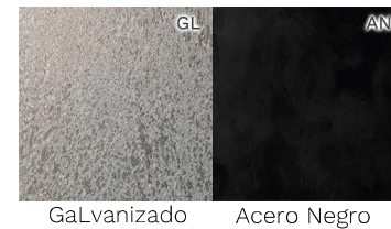
GaLvanizado Acero Negro

* La visualización de los colores por pantalla puede no corresponder exactamente con los colores reales.